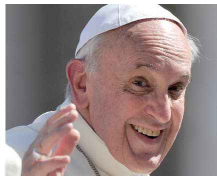
di Papa Francesco

Venerdì 14 Novembre 2014 alle ore 12.15, nell'Aula Paolo VI, il Santo Padre Francesco ha ricevuto in Udienza i partecipanti al Congresso mondiale dei Commercialisti. Pubblichiamo di seguito il discorso che il Papa ha rivolto ai presenti.