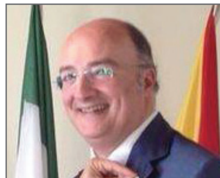
di Luigi Ferrajoli