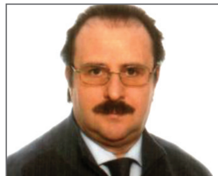
di Andrea Pellegrino

La rivoluzione della performance 1 nasce con il D. Lgs. 150/2009 (decreto c.d. Brunetta), fissando, in modo chiaro ed inequivocabile alcuni concetti che nel mondo della P.A., nel tempo, si erano persi: Misurazione – Meritocrazia – Trasparenza.