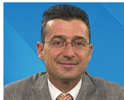
di Massimo Conigliaro

Non è soltanto un modo di dire ovvero una chiacchiera da bar: in questo particolare momento storico molte imprese sono a corto di liquidità, se non addirittura in crisi strutturale. E non sempre riescono a pagare le imposte ed i relativi accessori, nemmeno rateizzandoli.