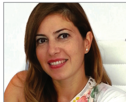
di Silvia Conte

A decorrere dal 2015, il regime speciale sulle operazioni di commercio elettronico per i soggetti <<business>> extra-UE verrà applicato anche ai servizi elettronici prestati da soggetti passivi stabiliti nella Comunità, ma non nello stato membro di consumo.