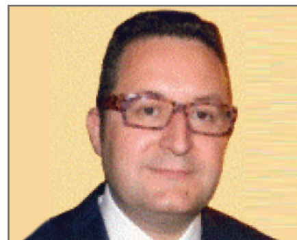
di Vincenzo Epifani

Tra le diverse attività cui sono chiamati i delegati, vi è quella tesa ad individuare e/o migliorare le forme di assistenza previste dal Regolamento per gli iscritti alla Cassa.