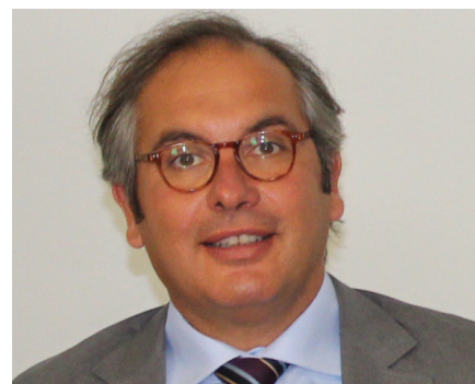
di Davide Piazza

L'enciclopedia Treccani definisce proroga: il prolungamento della durata di qualche cosa o rinvio del termine precedentemente stabilito per l'esecuzione di una prestazione. Nulla di nuovo da apprendere in questa sintetica definizione se non fosse che nel contesto delle scadenze fiscali l'uso poco misurato di tale pratica comporta lo sconvolgimento della tabella di lavoro di migliaia di professionisti oltre che scarsità di chiarezza nei confronti dei contribuenti, soggetti ultimi destinatari. Quanto ai professionisti, abituati a trattamenti irraguardevoli, si trovano a dover preparare mitici d-day dove sono concentrate decine di scadenze, attendendo notizie dai media sulla possibilità di ottenere la famigerata proroga solo per poter svolgere in modo corretto un lavoro che, non per loro colpa, devono necessariamente cominciare in ritardo. Gli uffici ministeriali che sono deputati a rendere noti i modelli dei dichiarativi e dei relativi studi di settore sono ormai da anni in cronico ritardo e non tengono in nessuna considerazione i tempi di lavoro di chi effettivamente dovrà op-