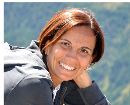
di Annalisa De Vivo

Con l'effettiva discesa in campo della Guardia di Finanza, chiamata dal D.Lgs. 231/2007 a svolgere attività di controllo sul territorio in relazione al corretto adempimento degli obblighi antiriciclaggio da parte dei professionisti destinatari della relativa disciplina, questi ultimi hanno dovuto acquisire familiarità non solo con la normativa primaria, ormai in vigore da molti anni, ma anche con la complessa regolamentazione attuativa e con la prassi inerente alla predisposizione delle misure antiriciclaggio all'interno degli studi professionali.