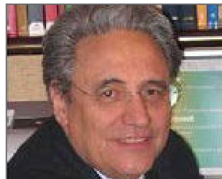
di Giancarlo Modolo