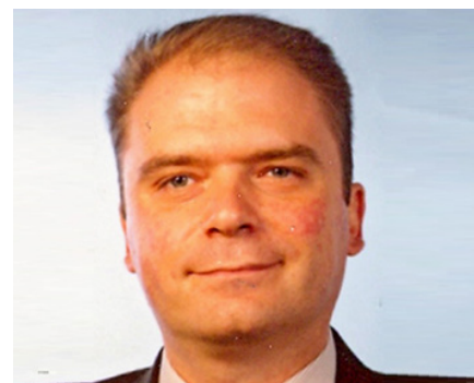
di Giovanni Valcarengi

L'articolo 1, comma 156 della legge n. 147/2013 (c.d. Legge di Stabilità 2014), prevede l'ennesima 1 possibilità di accedere all'incremento del valore fiscalmente riconosciuto di terreni e partecipazioni, a fronte del pagamento di una imposta sostitutiva. L'ambito di riferimento è bene noto, risalendo la norma "madre" agli articoli 5 e 7 della legge 28 dicembre 2001 n. 448, e le ipotesi di appetibilità si riscontrano per le casistiche in cui si prospetta all'orizzonte un possibile trasferimento plusvalente dei beni. Difficilmente, stante l'attuale situazione economica, invece, si ritiene che il provvedimento possa essere appetibile per coloro che intendono semplicemente "aggiornare" i valori, senza avere intenzione di giungere ad una cessione nell'immediato.