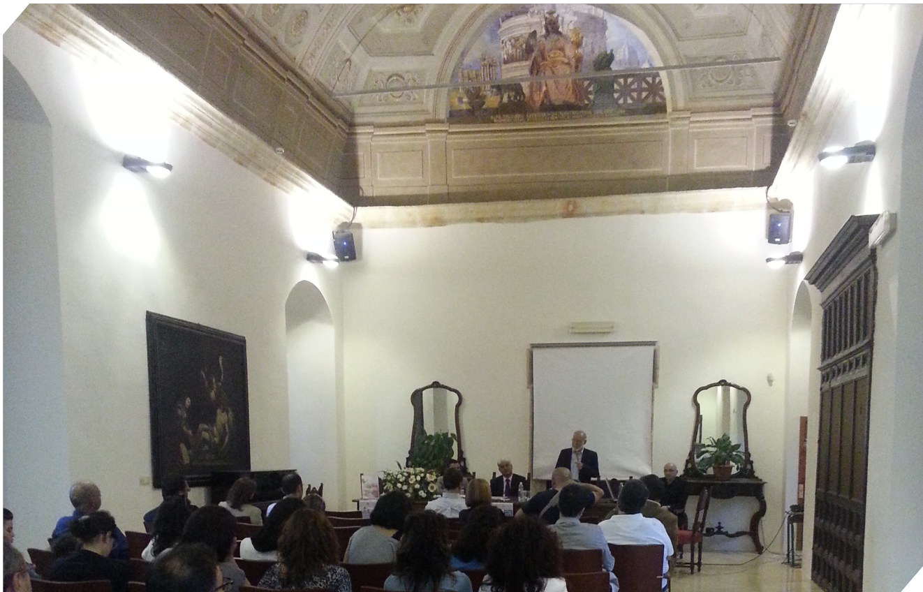
La cooperativa come opportunità di impresa e strumento di crescita sociale - Convegno. Latiano, 26 maggio 2014

Il fatto che in tutto il mondo un numero sempre maggiore di imprese abbia iniziato a redigere l'Integrated Report è un segnale inequivocabile di quale sarà la rendicontazione esterna dei prossimi anni. Non c'è partita con le altre forme di rendicontazione, come testimoniano in maniera inequivocabile i capitoli sesto, settimo e ottavo del libro Ipsoa "Nuovo bilancio integrato", grazie anche agli illuminati esempi concernenti storie di creazione di valore da parte di imprese manifatturiere, enti finanziari e creditizi, a matrice sia nazionale che internazionale.