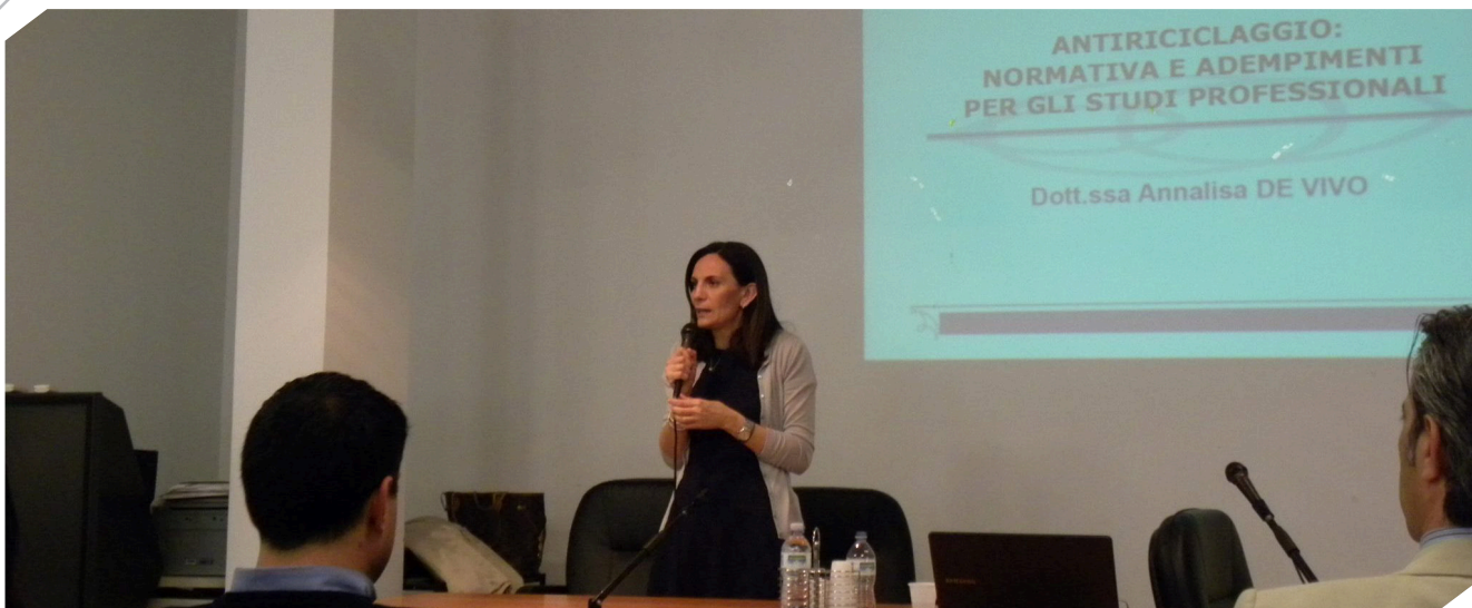
Lo studio professionale in regola con la normativa antiriciclaggio. Brindisi, 23 aprile 2014.

Tutti questi profili di criticità, in questa sede solo sommariamente descritti, sono stati e dovranno continuare ad essere oggetto di costante sottolineatura in tutte le sedi opportune, nella convinzione che la fase di recepimento delle indicazioni provenienti dal legislatore comunitario debba essere attuata in modo maggiormente coerente rispetto al contesto professionale nel quale le stesse trovano poi concreta applicazione.