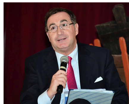
di Francesco Lenoci