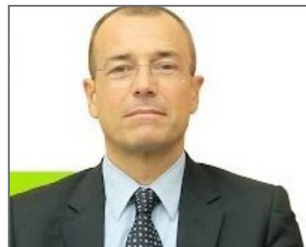
di Ernesto Gatto