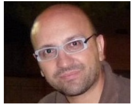
di Gabriele Albanese